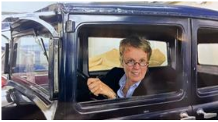
‘Ich bin dann mal weg.....’