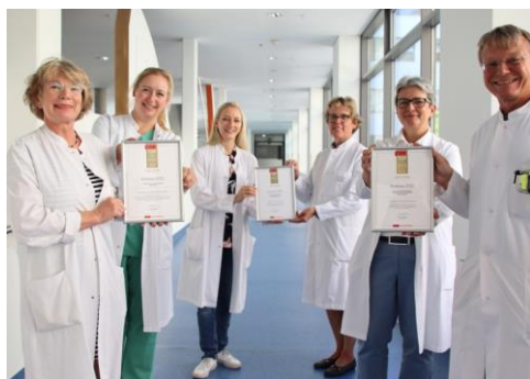
Gut sein – ist TEAMLEISTUNG!

Die Hautklinik im Klinikum Dortmund ist erneut FOKUS gelistet: zum einen als ein Top-Krankenhaus und auch gezielt genannt für die Versorgung von Hautkrebs und Palliativmedizin.